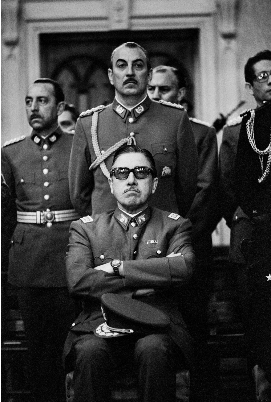
generaal Augusto Pinochet met officieren voor het begin van de Heilige mis ter ere van Chili's onafhankelijkheid en voor de zegening van de nieuwe militaire junta, Iglesia de la Gracitud Nacional, Santiago, 18 september 1973