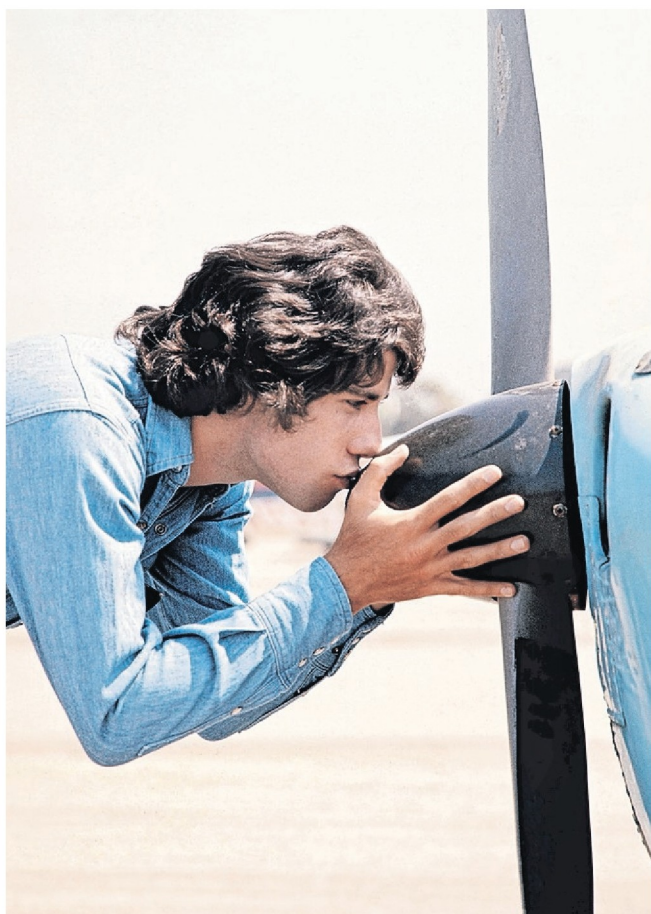
John Travolta was in 1975 nog een vrij onbekende acteur toen hij werd geportretteerd terwijl hij een vliegtuigpropeller kust.