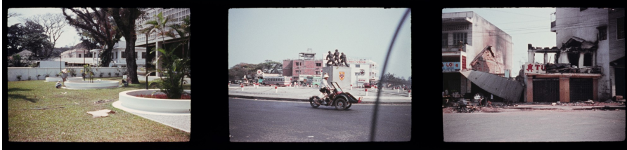
het terrein van de Amerikaanse ambassade (l.) en verwoestingen door het oorlogsgeweld (m., r.), Saigon, Zuid-Vietnam, 1968