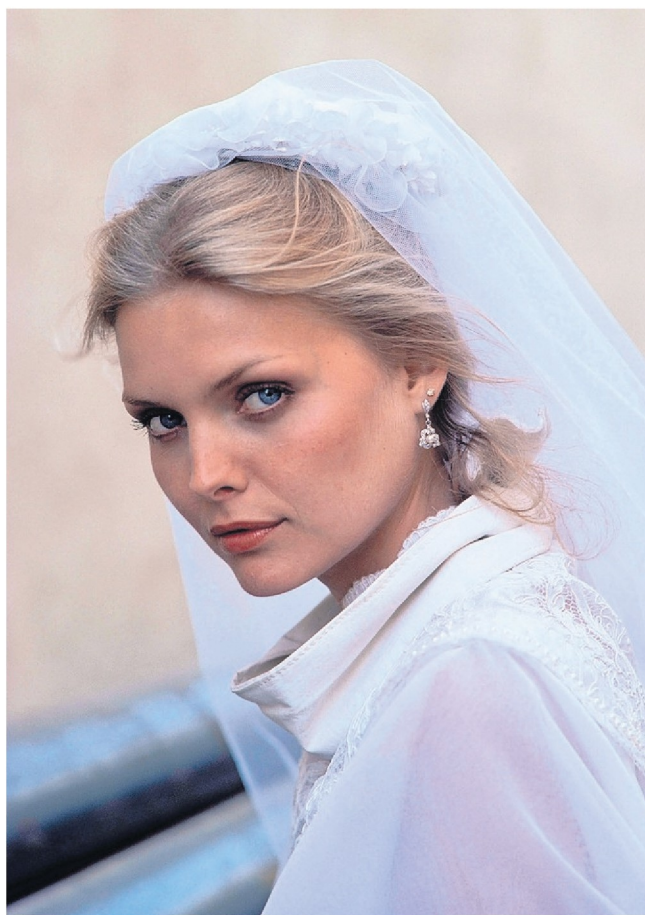
Michelle Pfeiffer, gefotografeerd tijdens de opnamen van de film 'Charlie Chan and the Curse of the Dragon Queen'.