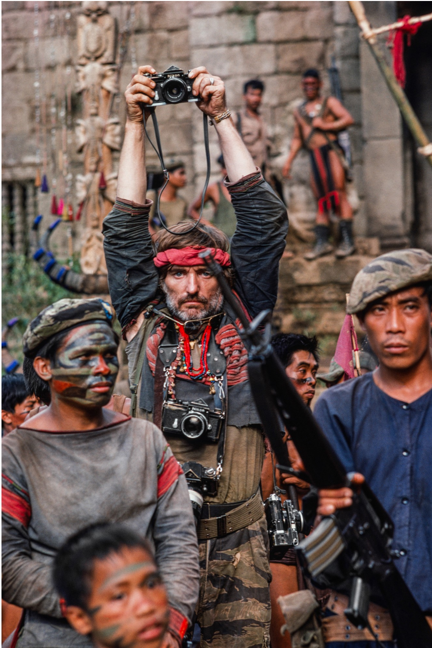
Dennis Hopper tijdens opnamen van Apocalypse Now , Filipijnen, 1976