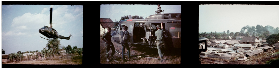
Amerikaanse legerhelikopter naar Saigon (l., m.) en luchtopname met zicht op basiskamp Go Dau Ha van de Amerikaanse Special Forces (r.), Zuid-Vietnam, 1968

‘De meeste mensen vergelijken hun ervaringen – echte of ingebeelde – met die van mij. Ze stellen zich voor wat ze in mijn situatie zouden doen’, stelt Gerretsen. ‘En dat is echt een probleem voor me. Want mensen kunnen zich geen voorstelling maken van oorlog. En toch geloven ze dat zij het beter weten dan iemand die het heeft gezien. Als ik vertelde over Vietnam, zeiden ze gewoon: “Nee hoor, dat is niet zo.” De meeste mensen beweren ook dat ze zich onrecht aantrekken. In werkelijkheid geven ze meer om persoonlijk ongemak, zoals het dragen van een mondkapje, dan om duizenden burgerdoden door bommen, hongersnood of sancties door hun eigen regeringen. De meeste mensen geven niet veel om mensen die ze niet kennen, vooral niet als het uiterlijk van de slachtoffers verschilt van dat van hen. Mensen ontkennen dat, maar ik heb het steeds opnieuw gezien.’